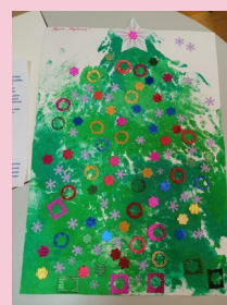
Вот так ёлочка-краса! Разбегаются глаза!!!